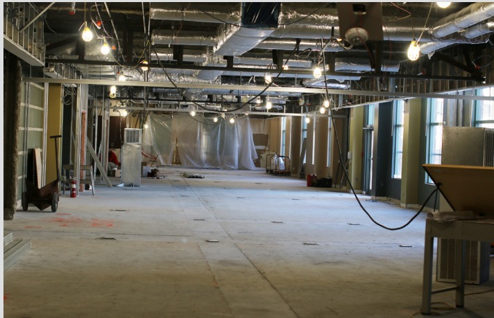
Renovaciones en el Centro de Conferencias en proceso