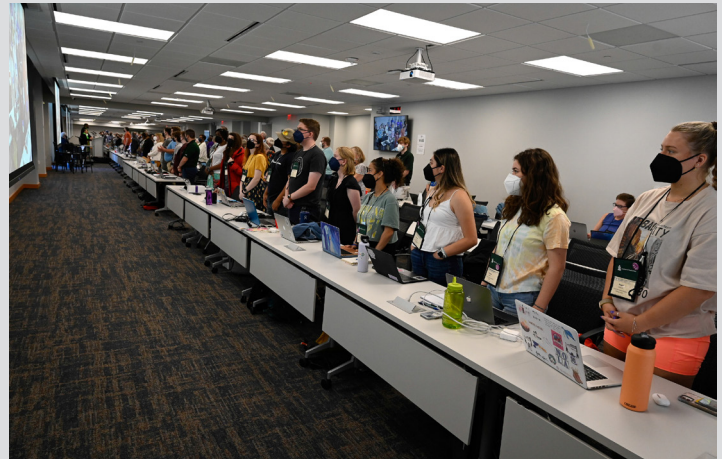
Delegados Asesores de la Juventud Adulta participan en la Plenaria 1 de la 225ª Asamblea General el 18 de junio del 2022